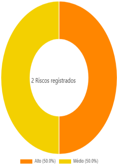
Lista dos Riscos